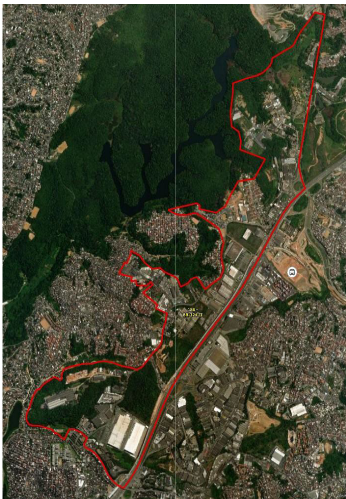
PROGRAMA LOGÍSTICO DE SALVADOR POLO LOGÍSTICO BR-324-II